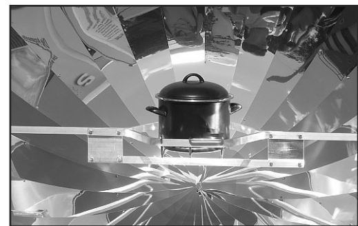
Umweltmarkt – Solarkocher