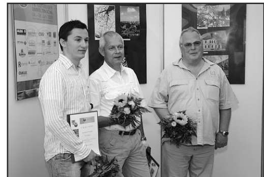
Drei der Sieger des Fotowettbewerbes