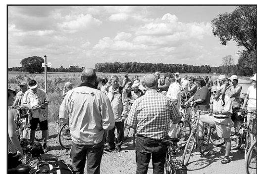
Ausflug in die Spreeaue