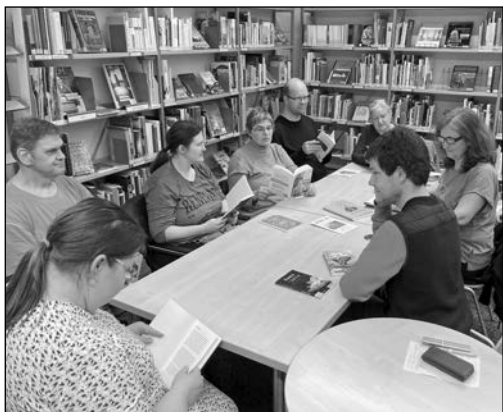
LEA Leseclub in der Stadt- und Regionalbibliothek

am 1. Donnerstag im Monat, 9:30 Uhr (Kunstkabinett)