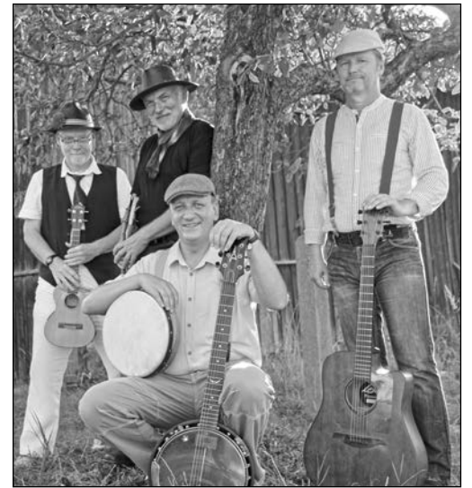
„Vier gute Saiten“

HERZSTÜCK: Handgemachte Musik zu jeder halben Stunde mit „Vier gute Saiten“ - Vier Cottbuser Amateurmusiker im besten Alter reisen voller fröhlichem Enthusiasmus musikalisch um die Welt oder suchen die Farbe GRÜN in der Musik. Ausschließlich akustische Instrumente kommen zum Einsatz.