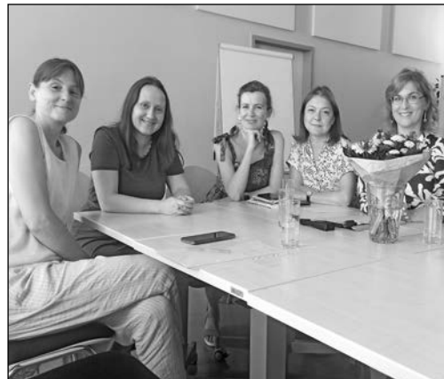
Leseclub in ukrainischer Sprache, 1. Treffen