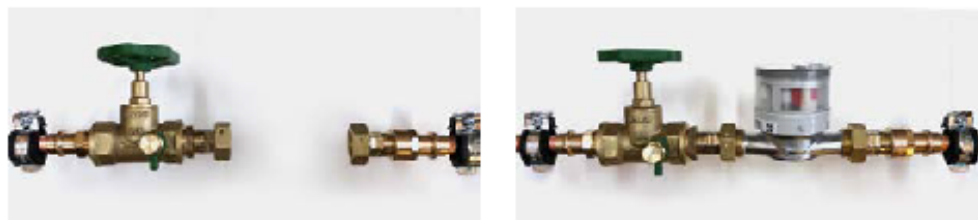
TECHNISCHE RICHTLINIE FÜR DEN EINBAU UND DIE VERÄNDERUNG VON GARTENWASSERZÄHLERN // SEITE 6 VON 6