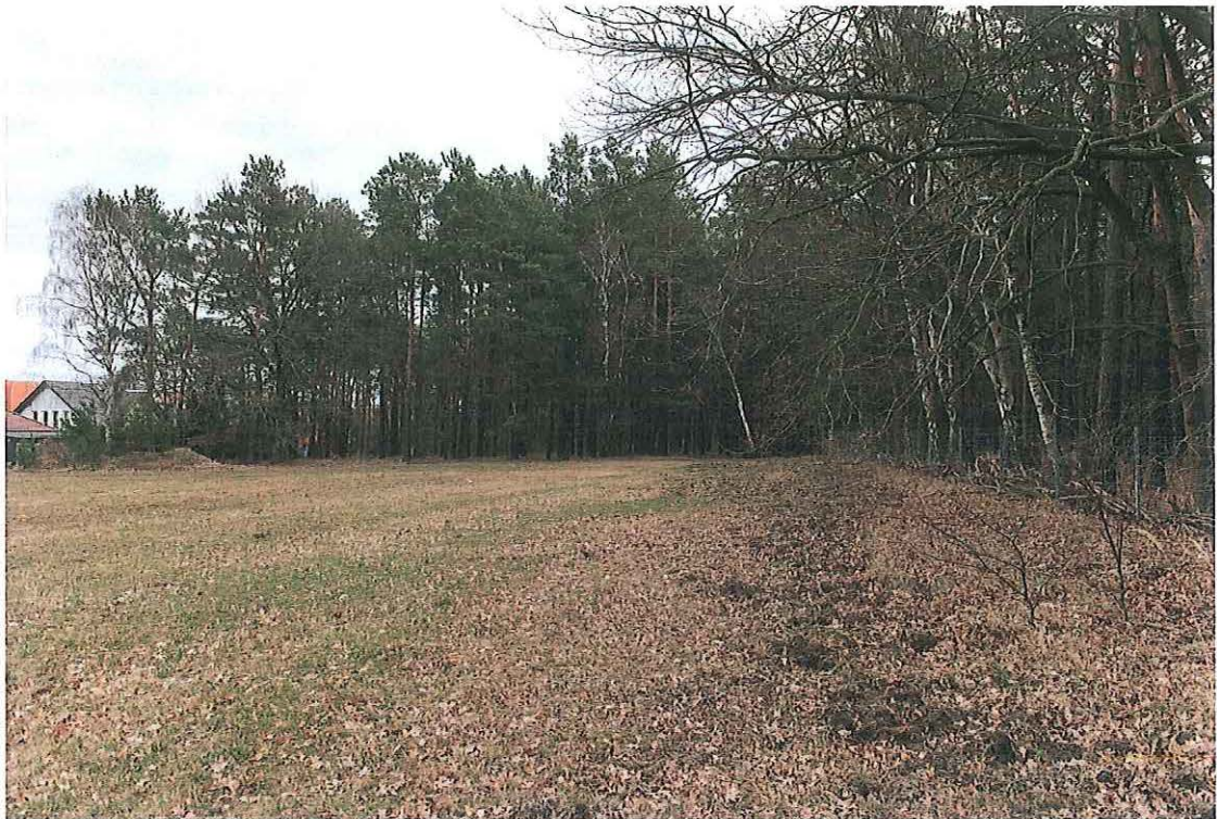
Blick nach Osten auf den Waldrand (Kiefernforst mit Birken und Eichen) im Südosten und Osten (März 2019)