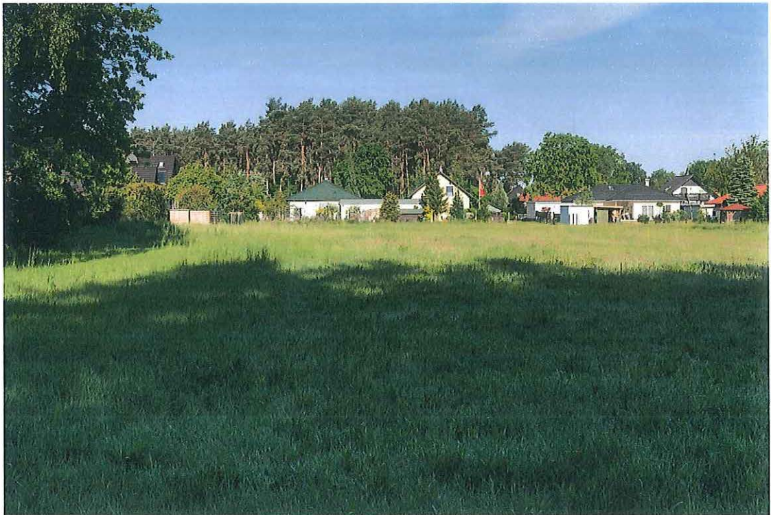
Blick vom Ostrand nach Westen auf die Vorhabensfläche; im Hintergrund ist die bereits vorhandene Bebauung entlang der Harnischdorfer Straße zu erkennen. (Mai 2019)