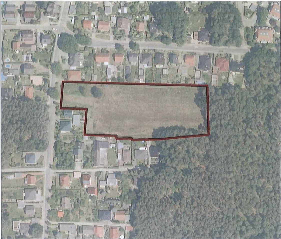
Abb. 1: Lage und Abgrenzung des B-Plangebietes "Am Birkengrund" OT Gallinchen.