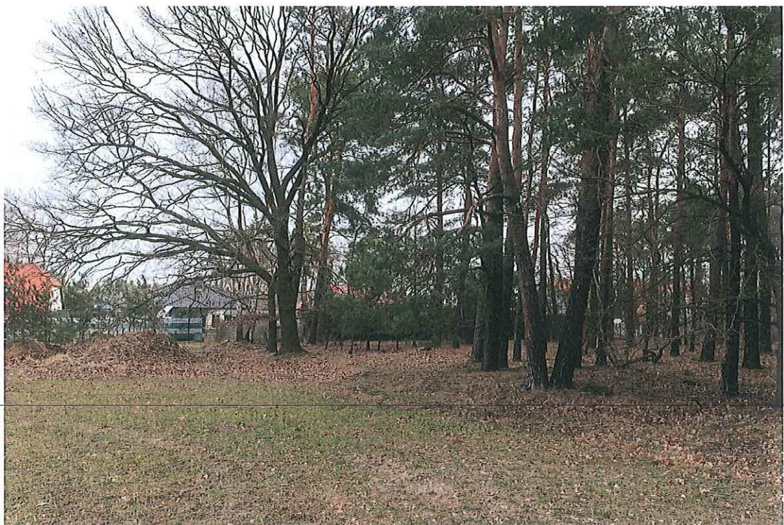
Blick nach den Nordostrand der Vorhabensfläche mit den mittelalten bis alten Kiefern und Eichen