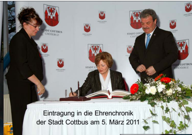
Eintragung in die Ehrenchronik der Stadt Cottbus am 5. März 2011