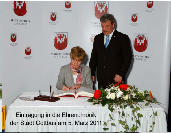
Eintragung in die Ehrenchronik der Stadt Cottbus am 5. März 2011