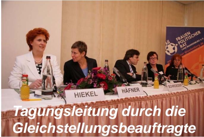
Tagungsleitung durch die Gleichstellungsbeauftragte