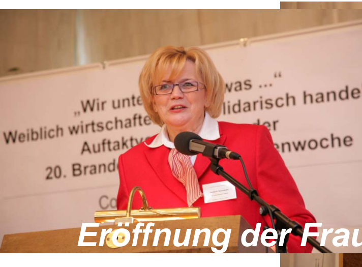
Eröffnung der Frauenwoche durch Schirmfrau und OB