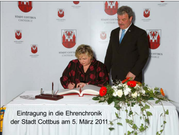
Eintragung in die Ehrenchronik der Stadt Cottbus am 5. März 2011